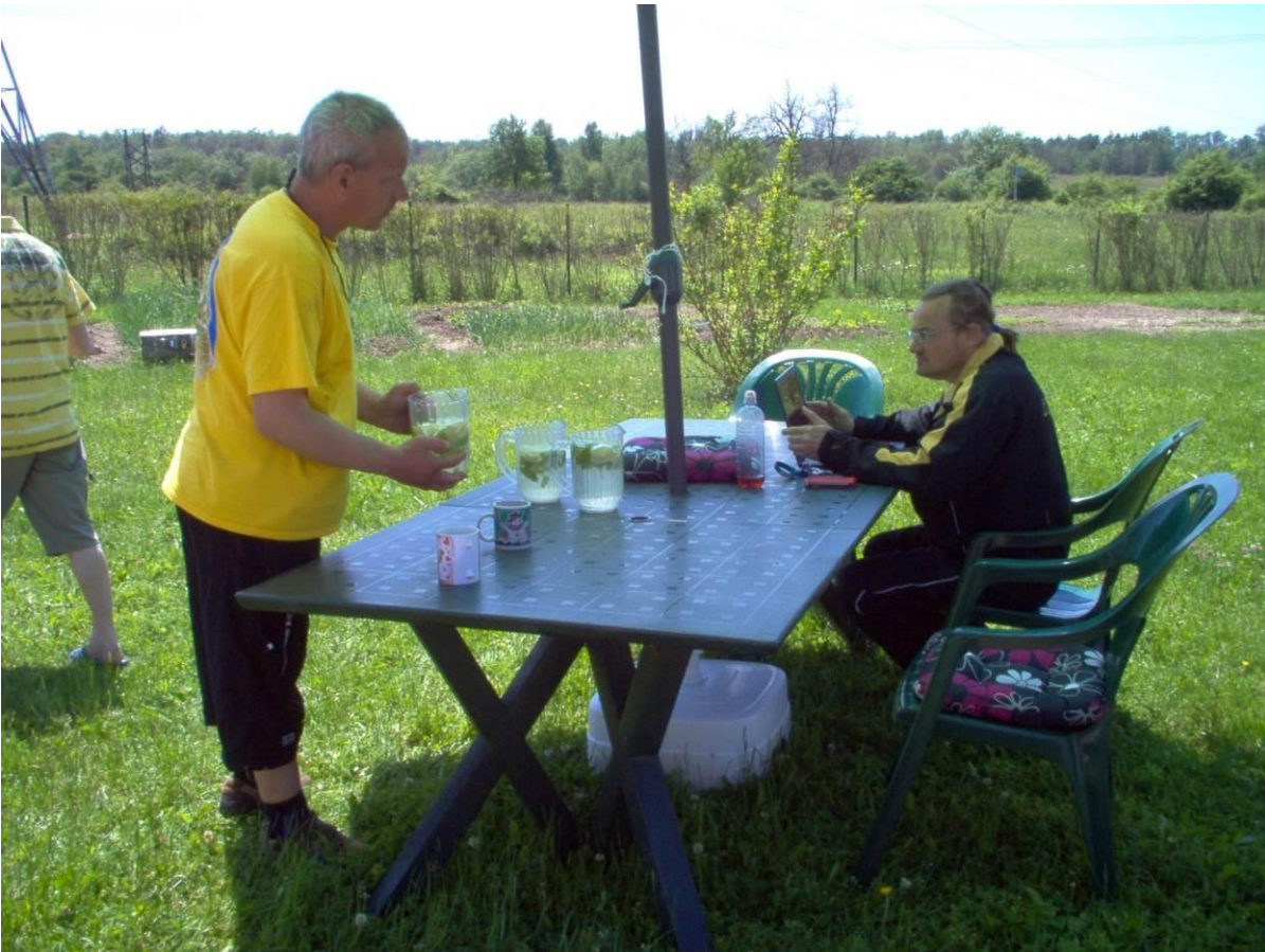
Az idei első bodzasörp bodzavirággal, citromkarikával, citromfűvel.