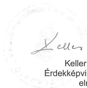
Keller Gyuláné Érdekképviselői Fórum elnöke